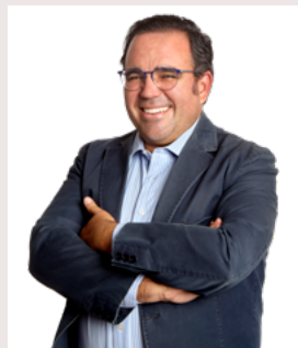
Javier Úbeda Liébana Alcalde de Boadilla